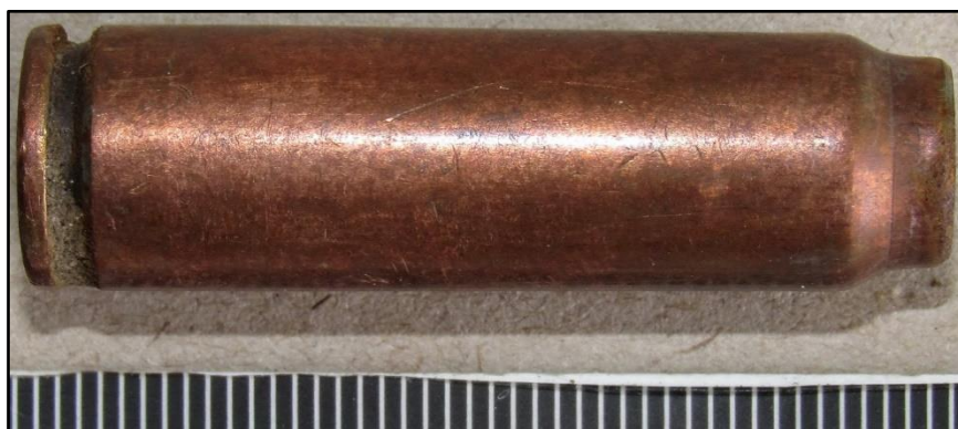
Зображення № 7. Донце та штовхач гільзи патрона СП-4 калібру 7,62x41 мм.