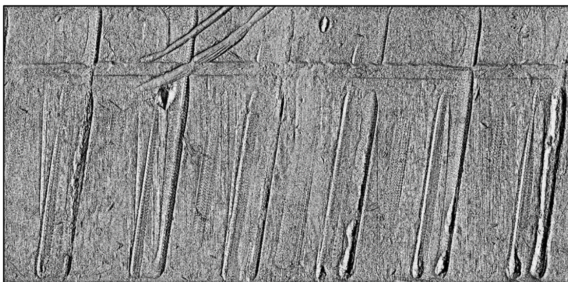
Зображення № 10. Сліди полів нарізів на кулі патрону СП-6.

В свою чергу всі 9-мм спеціальні патрони є варіантами патрону одного виду, які відрізняються різною конструкцією куль та різною масою порохового заряду.