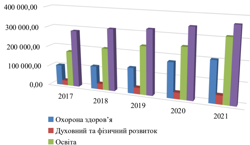
Рис. 2. Видатки державного бюджету України на розвиток людського капіталу у 2017–2021 рр., млн грн