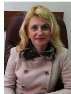
Ольга ПАВЛИК © кандидат педагогічних наук, доцент (Хмельницький університет управління та права імені Леоніда Юзькова, м. Хмельницький, Україна)