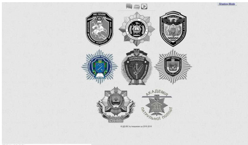
Рис. 1. Загальний вигляд веб-ресурсу «Лінія 102»

Найбільш яскравим прикладом реалізації поліцейського квесту є навчальна інформаційно-технічна платформа комплексних оперативно-тактичних навчань «ЛІНІЯ 102» [3, с. 156–201]. Дана ділова гра являє собою комплексні оперативно-тактичні навчання. Вона запроваджена як різновид навчальної або позанавчальної роботи з курсантами та студентами випускних курсів. Інформаційно-технічна платформа впроваджена в усіх навчальних закладах системи Міністерства внутрішніх справ. Вона розміщена на хостингу та підтримується фахівцями Дніпропетровського державного університету внутрішніх справ. Веб-вузол 102.dduvs.in.ua має вигляд (рис. 1):