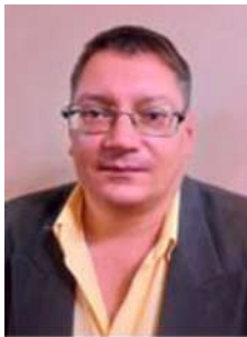
Краснобрижий І.В. © кандидат юридичних наук