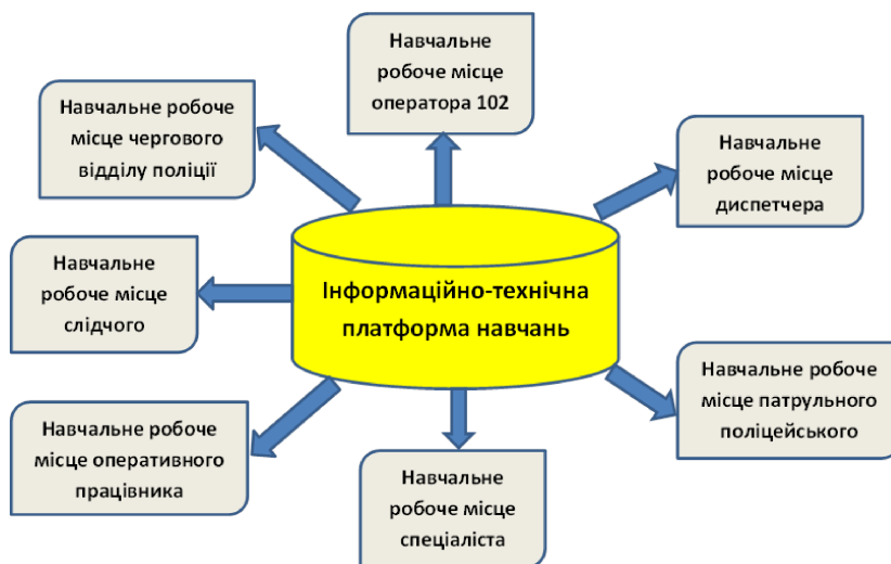
Рис. 2. Загальний вигляд інформаційно-технічної платформи «Лінія 102»

Інформаційно-технічна платформа складається з таких навчальних місць (рис. 2):