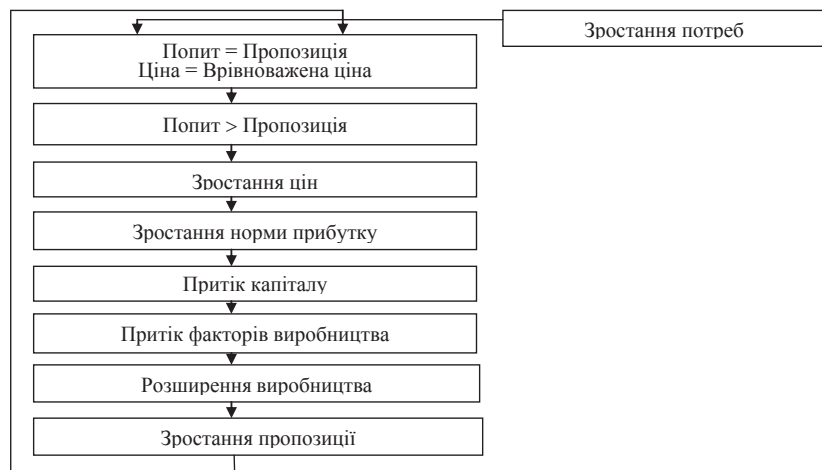
Рис. 1. Механізм функціонування ринку інвестиційних ресурсів будівельної галузі [2, с. 105–106]

Тому, на думку автора, є доцільним дослідити формування ринку інвестиційних ресурсів у будівельній галузі, починаючи з формування попиту та пропозиції як основного механізму ринку.