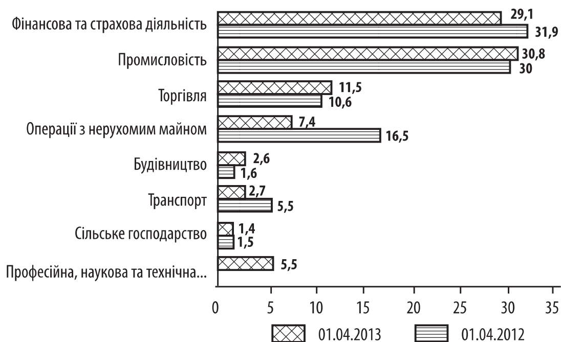
Рис. 2. Розподіл прямих іноземних інвестицій за основними видами економічної діяльності (у % до загального обсягу інвестування)