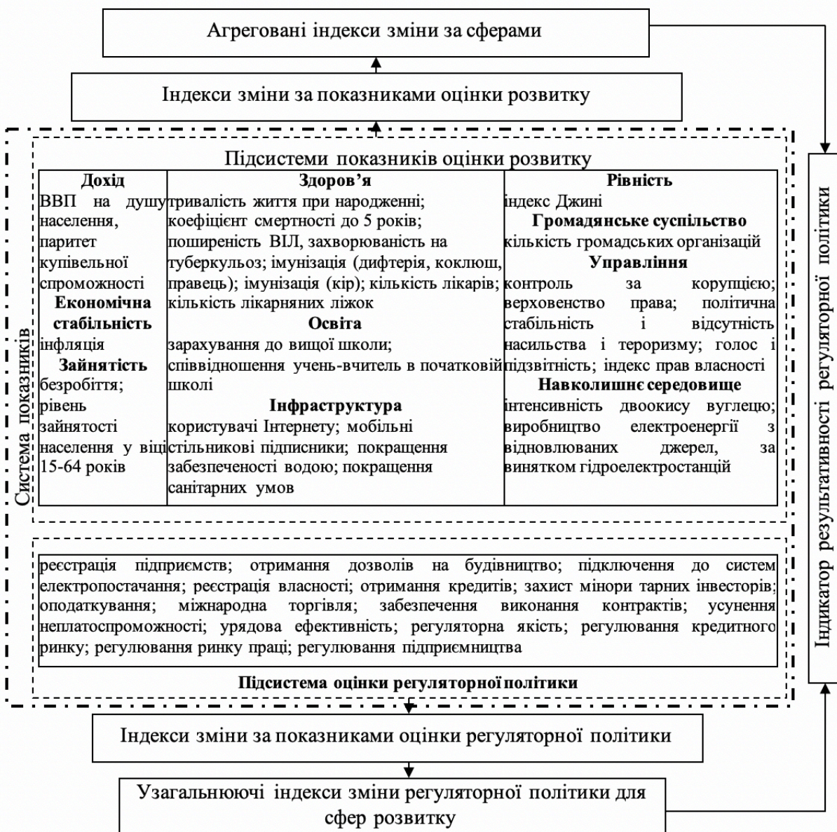
Рис. 2 Місце системи показників оцінки розвитку національної економіки в оцінюванні регуляторної політики

На рис. 2 представлено місце системи показників оцінки розвитку національної економіки в оцінюванні регуляторної політики.