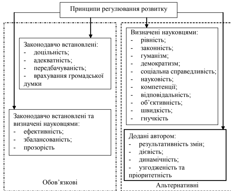
Рис. 2. Систематизація принципів регулювання розвитку, на яких базується регуляторна політика