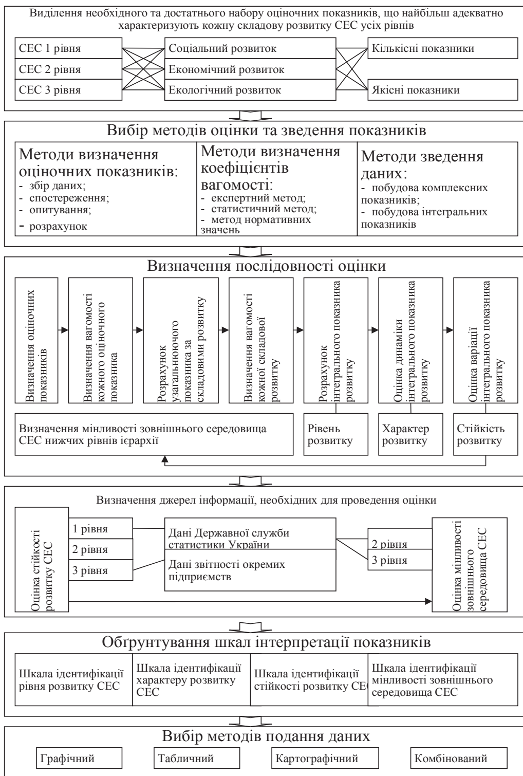
Рис. 1. Методологія оцінки стійкості розвитку СЕС та мінливості її середовища

Серед усіх можливих методів подання даних пропонується застосовувати комбінований метод, який передбачає застосування графіків та таблиць.