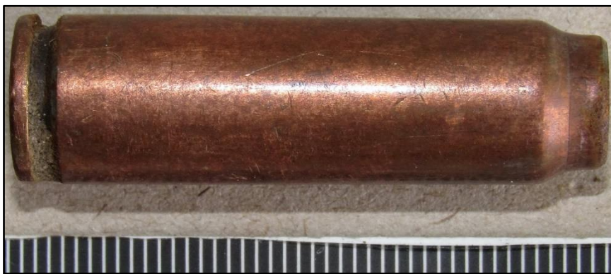
Зображення № 7. Донце та штовхач гільзи патрона СП-4 калібру 7,62х41 мм.