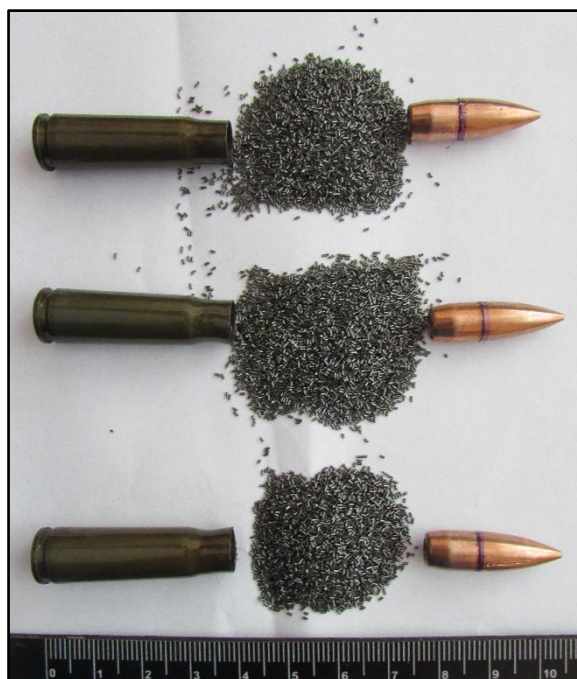
Зображення № 6. 7,62-мм патрон УС зр. 1943 р. зі зменшеною швидкістю (інд. 57-Н-231У), призначений для стрільби з приладом безшумної та безполум'яної стрільби ПББС-1.

Патрон СП-4, штатний до пістолету ПСС, який використовує один поршень-штовхач (обтюратор), що не виступає уперед з гільзи та виштовхував кулю у момент пострілу, запираючи порохові гази в корпусі гільзи, тим самим забезпечуючи безшумну та безполум'яну стрільбу. Автоматну кулю замінено на спеціальну, циліндричну кулю калібру 7,62 мм, виконану зі сталі. Для забезпечення обертання кулі по нарізах стволу в її передній частині є мідний ведучий поясок. Патрон СП-4 калібру 9x42 мм забезпечує безшумну та безполум'яну стрільбу, ефективна дальність при використанні пістолета ПСС досягає 25 м. Куля масою 9,3 г забезпечує безшумність, безполум'яність та бездимність пострілу. Особливостями СП-4 є: обтюрація продуктів згоряння порохового заряду та капсульного складу всередині гільзи; форма головної частини (плоска); куля СП-4 складається зі порошкового композиційного сплаву (заліза, цинку, свинцю та марганцю), не має оболонки (за виключенням ведучого мідного пояску); наявність лаку-герметику темно-червоного кольору по краю денця гільзи, в місці її з'єднання з кулею, низька початкова швидкість кулі (195-205 м/с). На відстані 30 м пробиває сталевий аркуш завтовшки 5 мм. При створенні патрону СП-4 калібру 9x41 мм проблему висування пістона (поршня-штовхача) було вирішено, металевий пістон повністю залишається в патроні. Після вдосконалення даний патрон стало можливим застосовувати в компактному самозарядному безшумному пістолеті ПСС (зображення № 7, 8).