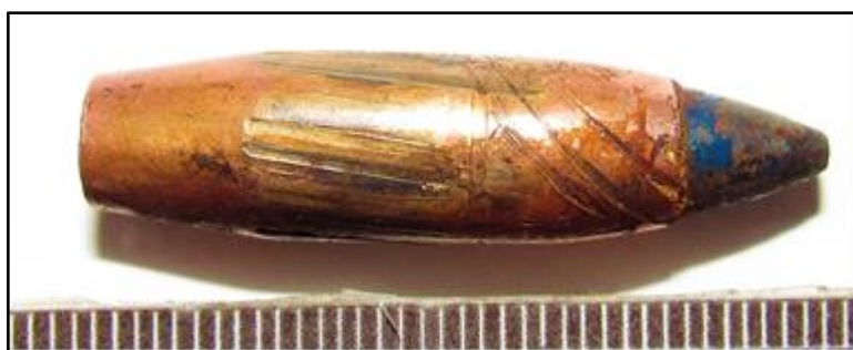
Зображення № 9. Куля патрону СП-6.