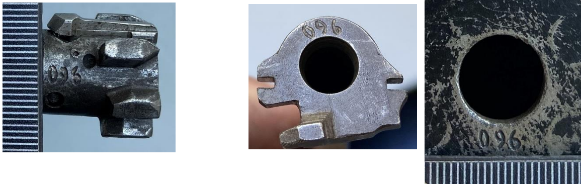
Зображення № 3. Маркувальні позначення на затворі, трубі зворотного механізму до затвора та дульному зрізі гвинтівки спеціальної «Вінторез».

Зазначене стосується й боєприпасів, розробники яких можуть орієнтуватися на існуючий патрон (в його теперішньому або модифікованому виглядах, наприклад патрони для безшумної стрільби – індекси СП-4, СП-5, СП-6, СП-10, СП-16) (зображення № 4, 5). В окремих випадках патрон створюється паралельно зі зброєю.