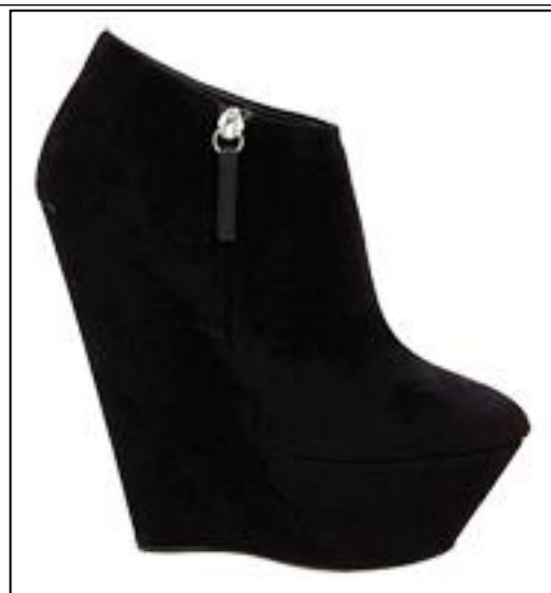
Рис. 1-8. Зразки сучасного взуття з нетиповою підошовною частиною.