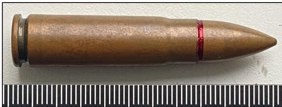
Зображення № 5. Спеціальний патрон СП-6.