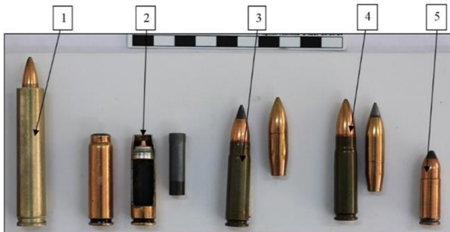
Зображення № 4. Спеціальні патрони: 1 – СП-3; 2 – СП-4; 3 – СП-5 9x39 мм; 4 – СП-6 9x39 мм; 5 – СП-10 9x21 мм.

Зазначене стосується й боєприпасів, розробники яких можуть орієнтуватися на існуючий патрон (в його теперішньому або модифікованому виглядах, наприклад патрони для безшумної стрільби – індекси СП-4, СП-5, СП-6, СП-10, СП-16) (зображення № 4, 5). В окремих випадках патрон створюється паралельно зі зброєю.