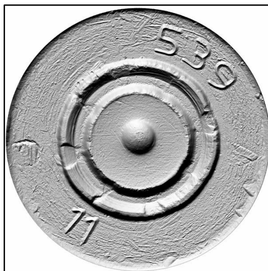
Зображення № 8. Сліди від частин зброї на гільзі патрона СП-4 калібру 7,62х41 мм.