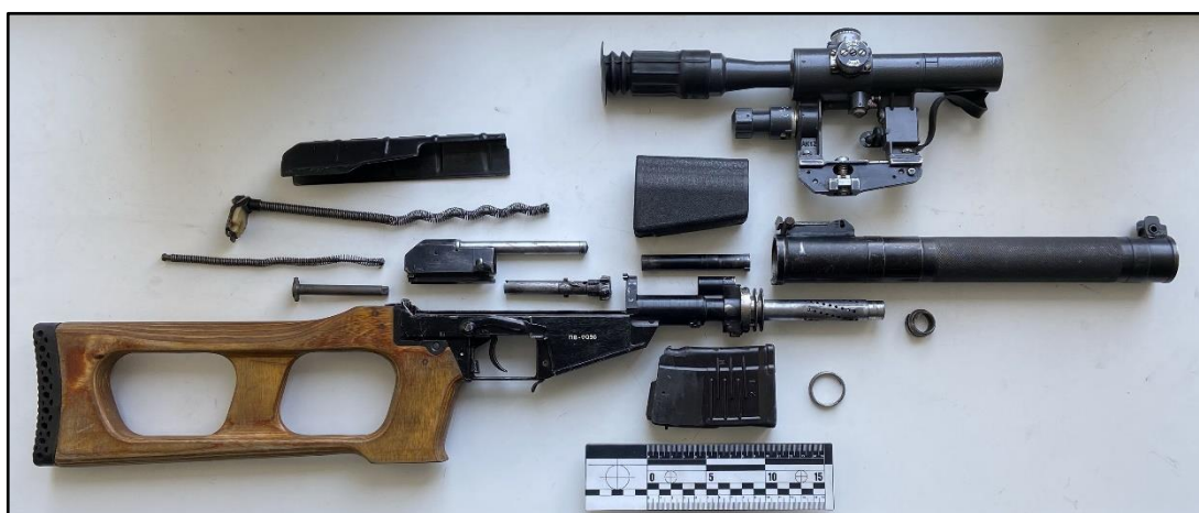
Зображення № 1. 9,0-мм гвинтівка спеціальна снайперська «Вінторез» у демонтованому стані.

5) пістолети-кулемети – 9,0-мм пістолет-кулемет ПП-2000, 9,0-мм пістолет-кулемет «Витязь-СН», 9,0-мм пістолет-кулемет СР-2 «Вереск», 9,0-мм пістолет-кулемет СП2МП, 9,0-мм спеціальний пістолет-кулемет ПП-90М1, 9,0-мм пістолет-кулемет ОЦ-02 (ТКБ-0217) «Кіпаріс», 9,0-мм пістолет-кулемет ПП-93, 9,0-мм пістолет-кулемет «Аграм 2000» (Хорватія), 9,0-мм пістолет-кулемет т МР5SD3: варіант МР5 (Австрія).