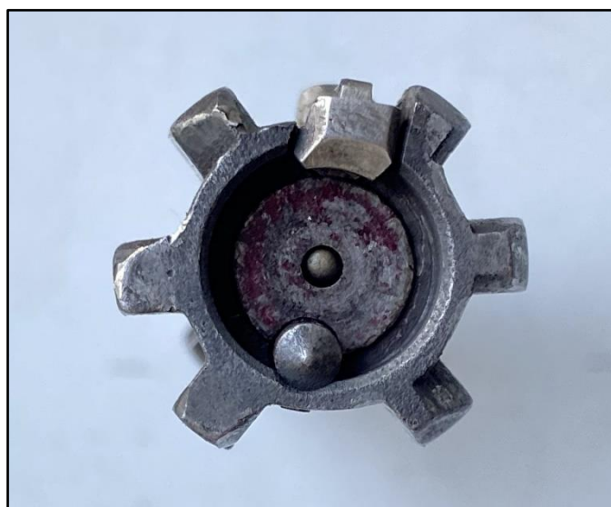
Зображення № 2. Чашка затвору гвинтівки спеціальної снайперської «Вінторез».