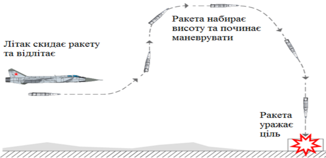
Рисунок 1. Загальна схема польоту ракети 9-С-7760 «Кинджал».

Для старту ракети літак повинен набрати потрібну висоту та ввести цілевказання для ракети. Після набору потрібної висоти відбувається скидання ракети, яка падає на безпечну дистанцію, виконується відстріл додаткового хвостового оперення та запуск двигуна. Зняті кадри показані на рисунку 2.