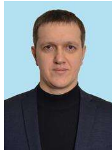
Дмитро САНАКОЄВ © кандидат юридичних наук, доцент (Дніпропетровський державний університет внутрішніх справ, м. Дніпро Україна)