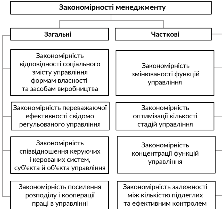
Рис.1.2.1. Закономірності менеджменту

елементів та явищ. Їх поділяють на загальні та часткові (рисунок 1.2.1.). Загальні закономірності притаманні всім системам управління, а часткові – пов'язані з функціонуванням окремих галузей, організацій, підприємств.