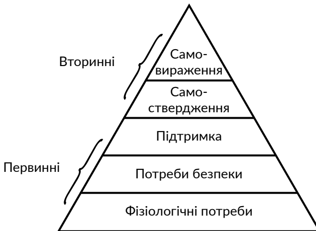
Рис. 2.3.4. Ієрархія потреб особистості за А. Маслоу

Маслоу та його послідовники вважають, що основною рушійною силою у діяльності індивідів є прагнення забезпечення задоволення своїх потреб, а об'єктом вивчення психології як науки виступає не свідомість людини, а її поведінка. На рис. 2.3.4. зображена ієрархічна модель потреб особистості відповідно до концепції Маслоу.