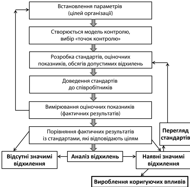
Рис. 4.4.1. Схема процесу контролювання