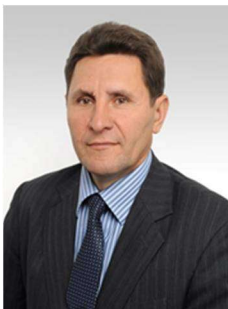
Іван БОГАТИРЬОВ © доктор юридичних наук, професор, заслужений діяч науки і техніки України (Міжнародний економіко- гуманітарний університет імені академіка Степана Дем'янчука, м. Рівне, Україна)