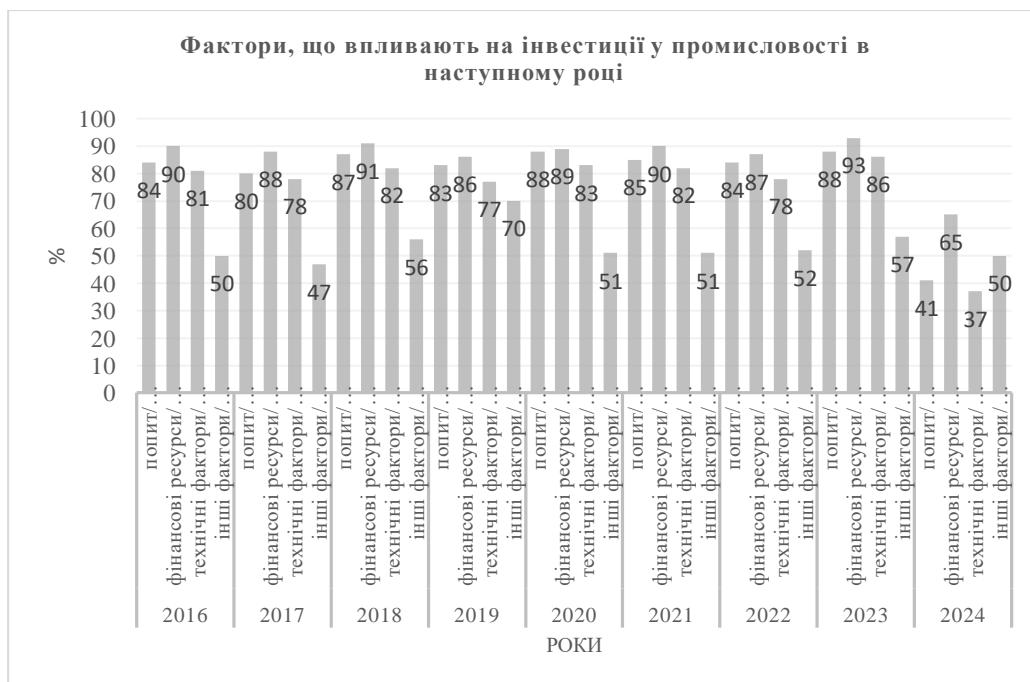
Рис. 3. Фактори, що впливають на інвестиції у промисловості в наступному році, % [2]

З рис. 2 можна зробити висновок, що після 2016 року очікувані зміни інвестицій у промисловості змінювались у від'ємному напрямі, тобто мали негативну тенденцію, тоді як, за даними Державного комітету статистики України, очікування від інвестиційної діяльності у 2024 році є позитивними, що говорить про очікування бізнесу іноземних інвестицій для відновлення території України, зміцнення міжнародної співпраці та очікування закінчення війни. Відновлення темпів виробництва та стабілізація валюти на міжнародному валютному ринку позитивно відобразились на тенденціях, що водночас сприяло покращенню показників оцінки подальшої виробничої діяльності. Однак спостерігається неоднорідність оцінки зміни інвестицій у промисловість залежно від діяльності, що говорить про необхідність створення додаткових інструментів для стабілізації бізнес-середовища.