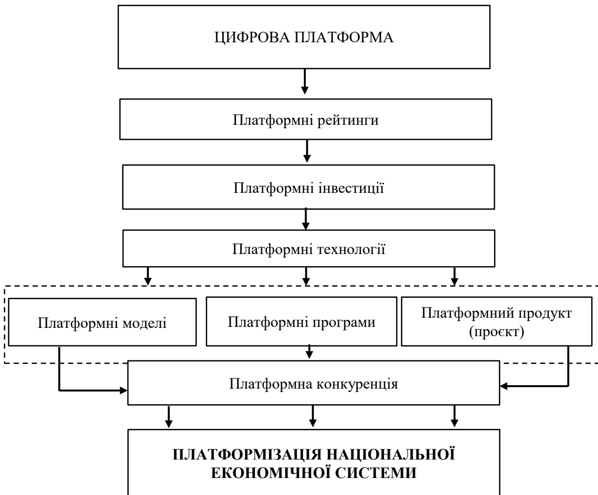
Рис. 1. Ієрархічна характеристика методологічних складових ідентифікації понятійно-категоріального апарату дефініції «платформізація»