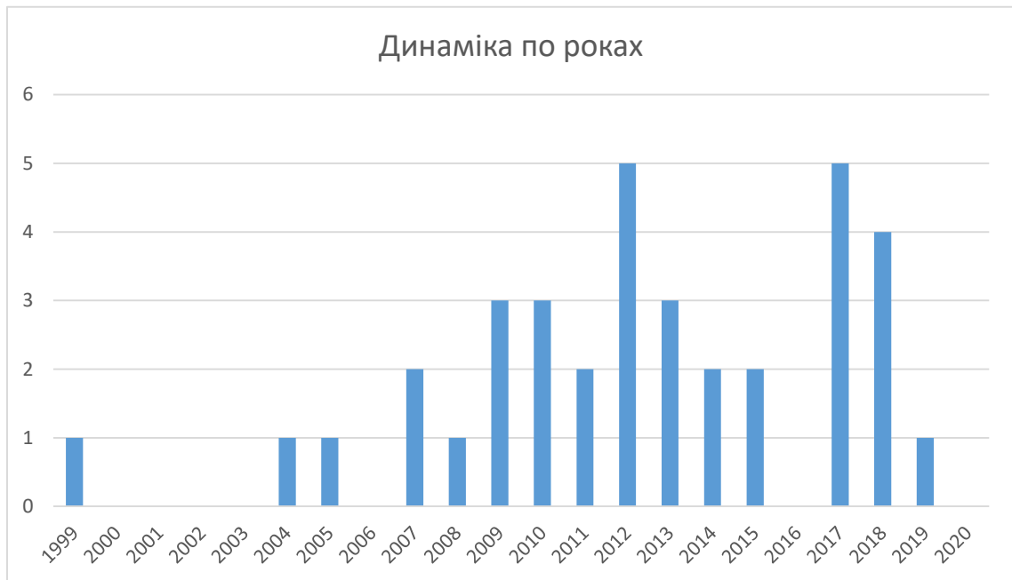
Табл. 2. Динаміка наукової розробки проблем теорії і практики оперативно-розшукової протидії злочинам у бюджетній сфері та сфері оподаткування у закладах вищої освіти

Незважаючи на значну кількість робіт, присвячених проблемним питанням теорії і практики оперативно-розшукової протидії кримінальним правопорушенням у бюджетній сфері та сфері оподаткування на сьогодні існують окремі проблеми, які залишилися поза увагою вчених та потребують вирішення, зокрема це проблеми оперативного супроводження кримінальних проваджень щодо кримінальних правопорушень у бюджетній сфері та сфері оподаткування та проблеми організації оперативного обслуговування кримінальною поліцією бюджетної сфери та сфери оподаткування.