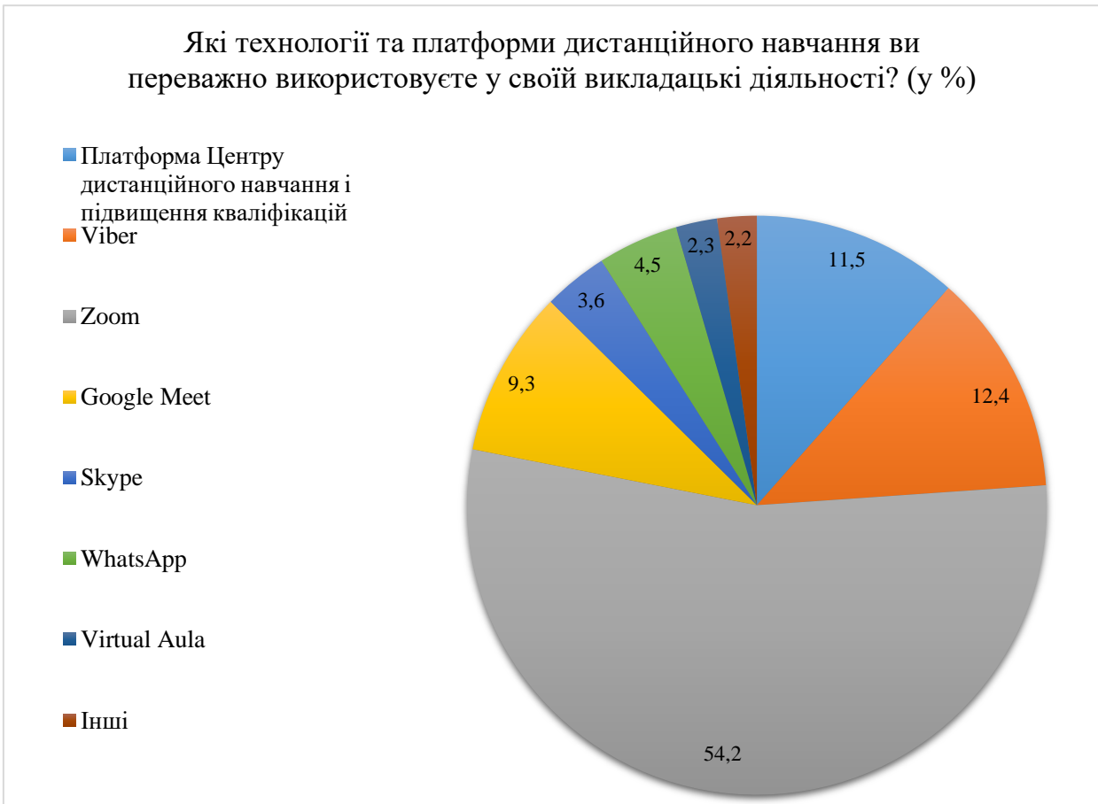
Рис. 1.1. Розподіл відповідей на запитання «Які технології та платформи дистанційного навчання ви переважно використовуєте у своїй викладацькій діяльності?» (у %)

Результати опитування дозволяють зробити висновок, що більше половини викладацького складу (54,2 %) в умовах пандемії, спричиненою SARS-CoV-2, а також у період з лютого 2022 по вересень 2023 року під час вимушеного перебування в укриттях та під час розосередження особового складу для дистанційного навчання використовує додаток Zoom. Це пояснюється тим, що цей додаток має доступний інтерфейс, що робить його легким для використання навіть для тих, хто не має великого досвіду роботи з технологіями. Платформа дозволяє проводити відеоконференції з великою кількістю учасників одночасно, що особливо важливо для великих груп здобувачів освіти. Також Zoom пропонує інтерактивні можливості, такі як чат, підтримка віртуальних дошок, спільний доступ до екрана та можливості розділення на підгрупи. Платформа відзначається стабільністю та достатньо високою якістю зв'язку, що дозволяє ефективно проводити заняття без перебоїв. Ці характеристики роблять Zoom привабливим для викладання занять для курсантів.