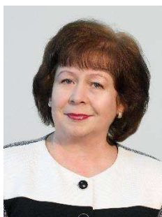
Галина ОХРОМІЙ © доктор медичних наук, професор (Дніпровський державний університет внутрішніх справ, м. Дніпро, Україна)

УДК 159.98 DOI: 10.32782/2078-3566/2025-5-27