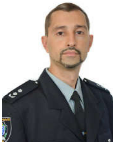
Собакарь А.О. © доктор юридичних наук, професор