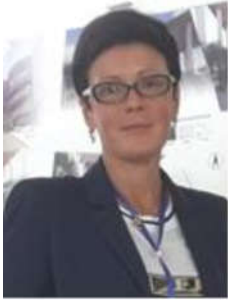
Алексеева І.В. © доктор політичних наук, професор (Дніпропетровський державний університет внутрішніх справ)