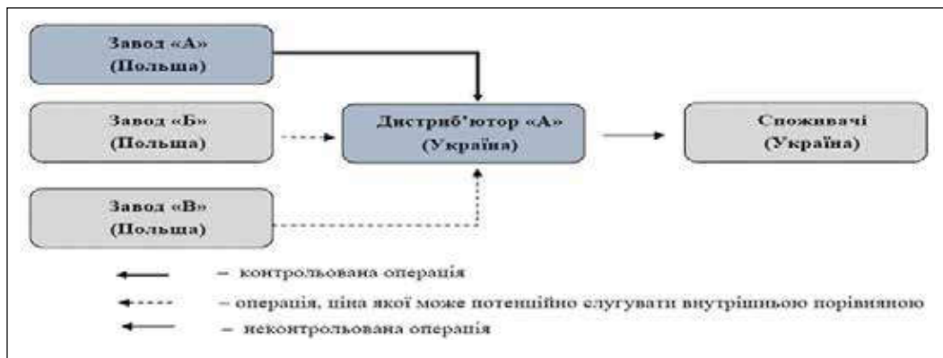
Рис. 3. Застосування внутрішньої порівняної ціни методу «витрати плюс»

Слід зазначити, що врахування переваг та недоліків кожного методу трансфертного ціноутворення дасть змогу компанії, що входить до міжнародної групи компаній, вибрати найбільш оптимальний метод для аналізу цін/показників рентабельності у контрольованій операції. Це дасть змогу уникнути матеріального та репутацій-