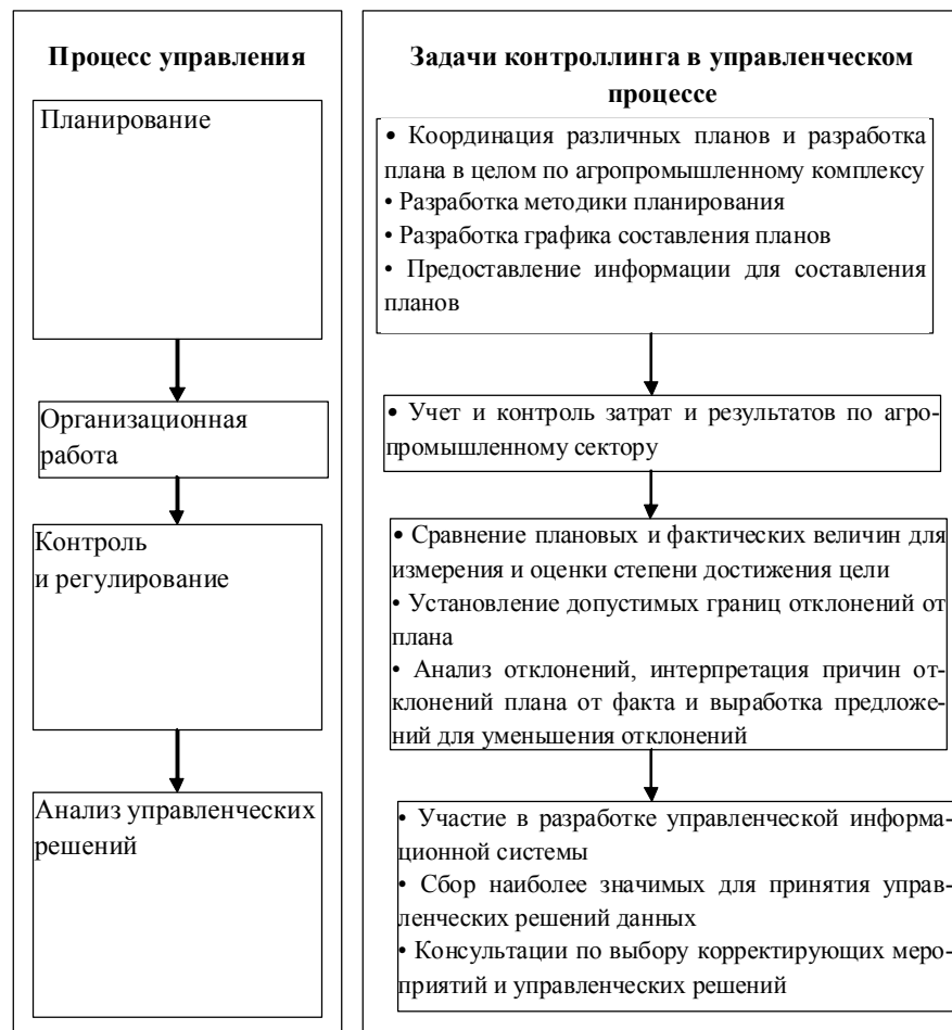
Рис. 4. Задачи контроллинга в процессе управления инвестиционным климатом в агропромышленном секторе национальной экономики

Как отмечает Беккер В.: «Инвестиционный контроллинг агропромышленного сектора не ограничивается осуществлением внутреннего контроля за осуществлением инвестиционной деятельности и инвестиционных операций, а является эффективной координирующей системой обеспечения взаимосвязи между формированием информационной базы, инвестиционным анализом, инвестиционным планированием и инвестиционным контролем» (рис. 4).