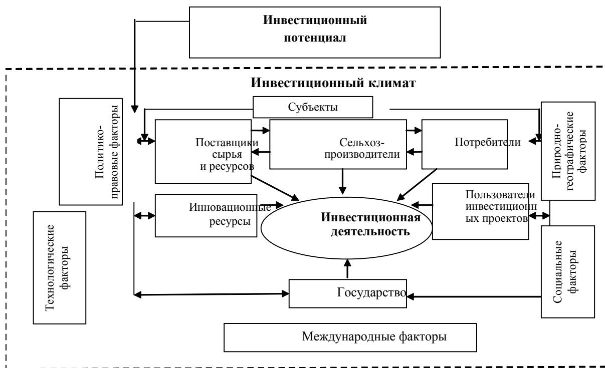
Рис. 2. Схема взаимодействия субъектов и объектов инвестиционной деятельности в агропромышленном секторе национальной экономики

ственном уровне совокупностью политических, правовых, социальных, экономических, а также других факторов, которые определяют предпочтения инвестирования экономических субъектов, обеспечивая продуктивную инвестиционную деятельность [7, с. 26–31].