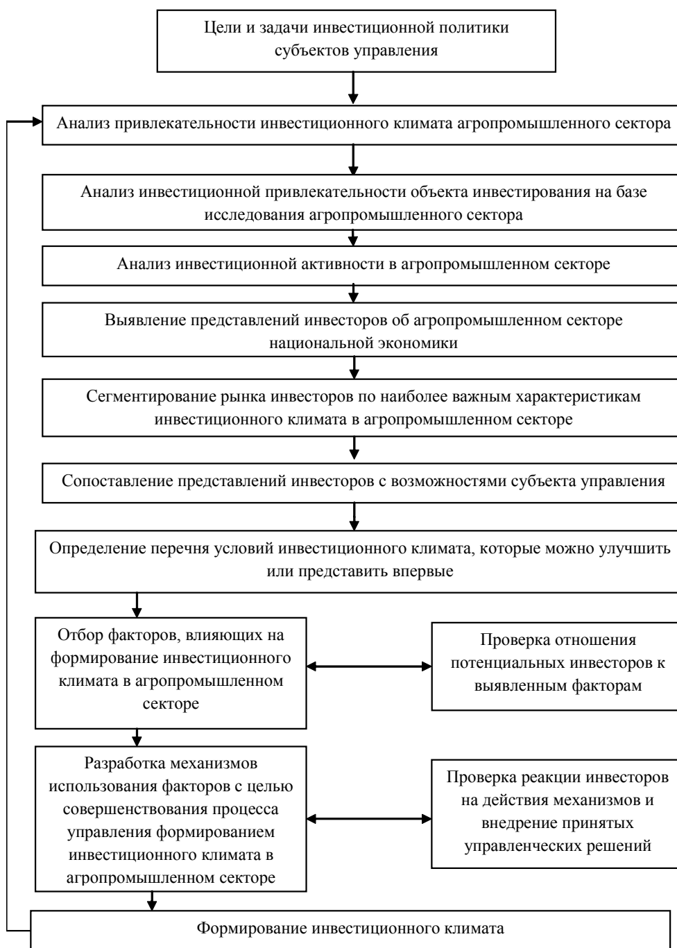
Рис. 3. Этапы процесса управления формированием инвестиционного климата в агропромышленном секторе экономики Украины (усовершенствовано автором на основе [8, с. 185 – 186])

Контроллинг включает в себя совокупность форм и методов планирования движения денежных инвестиционных потоков, а также обеспечивает контроль над ними.