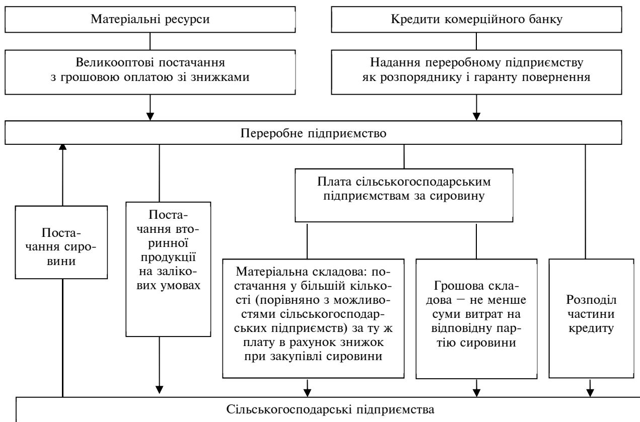
Рис. 4. Модель кооперації сільськогосподарських підприємств і підприємств харчової промисловості