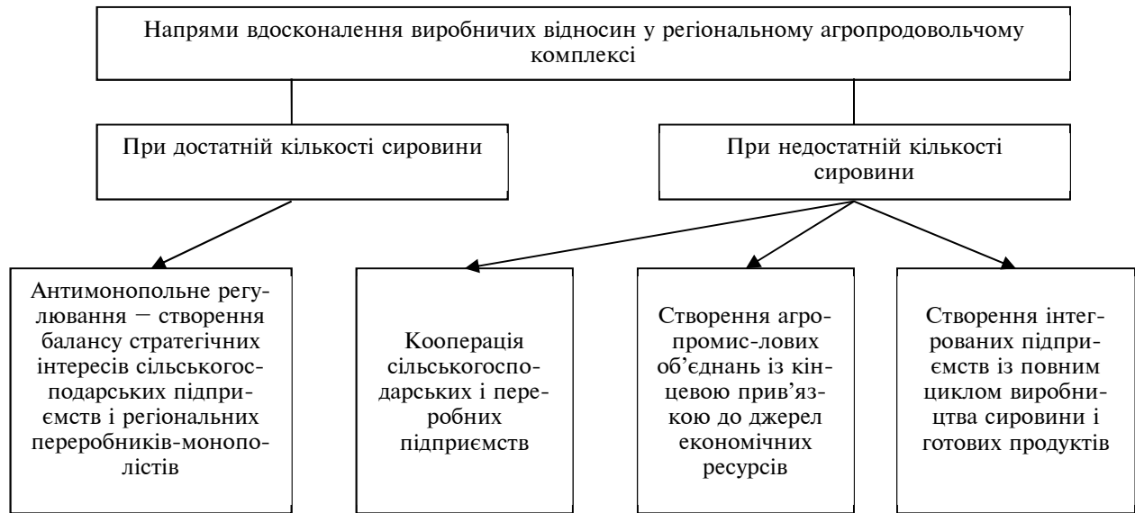
Рис. 3. Основні напрями вдосконалення виробничих відносин у агропродовольчому комплексі