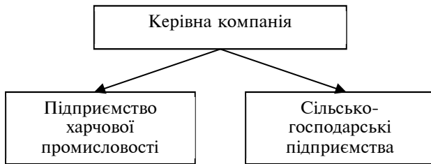
Рис. 5. Схема двоступеневої інтегрованої організації

Інвестиційні проекти в агропродовольчому комплексі вимагають ефективного управління ресурсами, для чого можуть створюватися вертикально інтегровані організації. Залежно від масштабу конкретних проектів і умов можливе створення двоступеневих інтегрованих організацій (рис. 5).