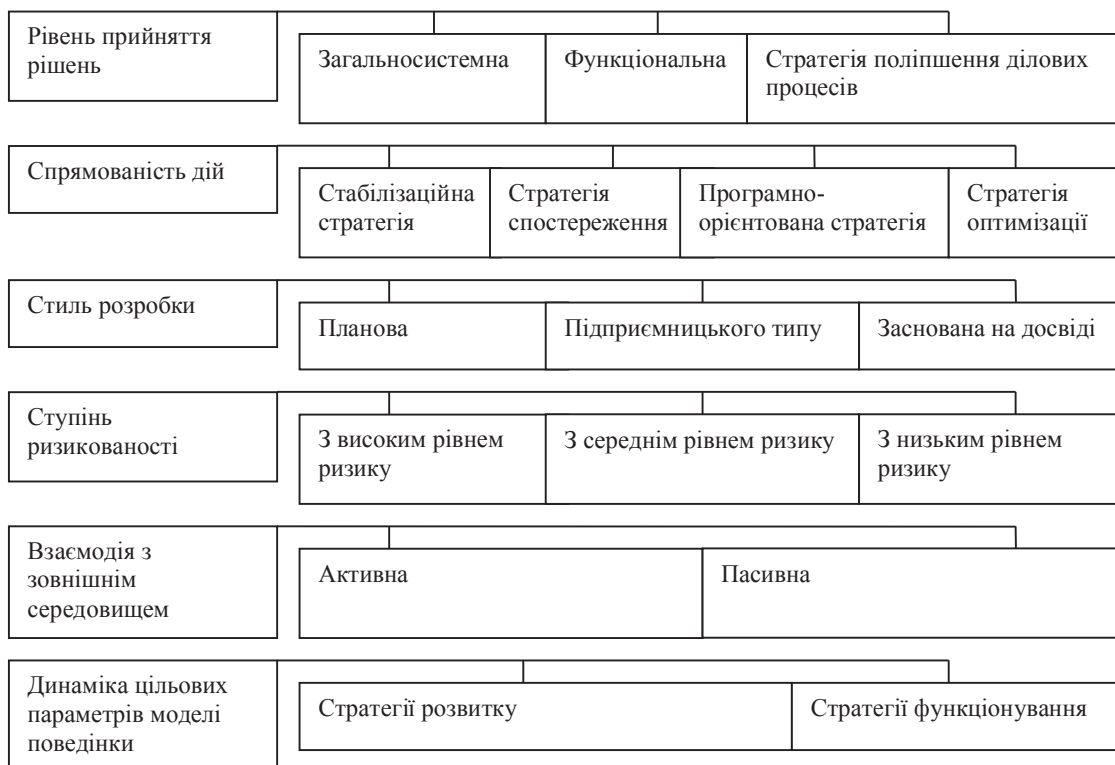
Рис. 1. Класифікація стратегій соціально-економічних систем

– ліберальна, яка вирізняється повною свободою розробки та реалізації стратегії;