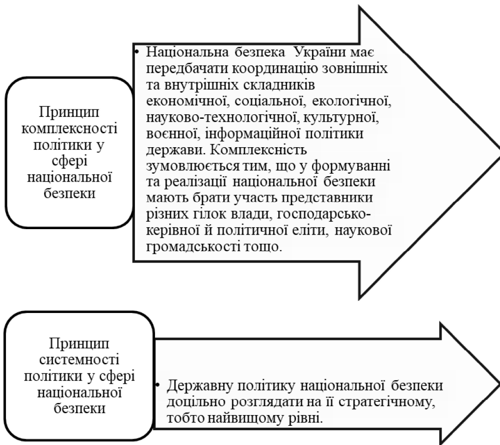
Рис. 3. Базові принципи побудови політико-правових методів впливу на національну безпеку держави