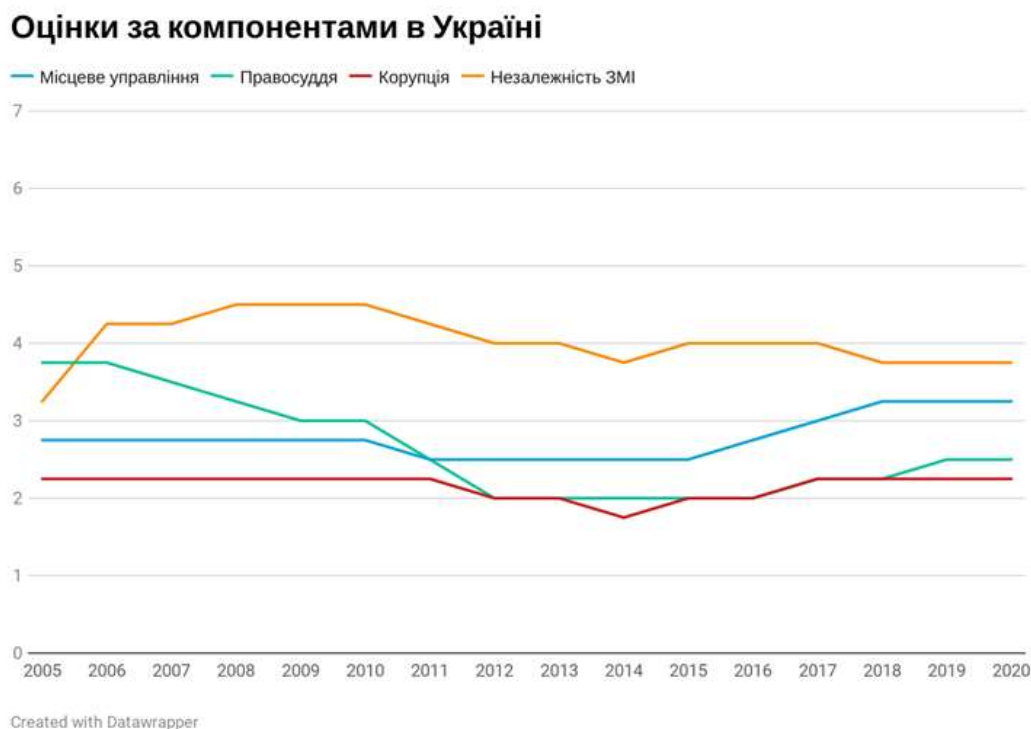
Рис. 2. Графічне порівняння компонентів демократії (місцеве управління, правосуддя, корупція, незалежність ЗМІ) за індексом Nation in Transit за 2005–2020 рр. [2]

Як бачимо, найвищу оцінку протягом тривалого часу має стан громадянського суспільства в Україні. Громадянське суспільство країни деякий час користується певною свободою. Завдяки перемозі В. Зеленського на виборах громадянське суспільство отримало можливість узяти безпосередню участь в управлінні державою. Але незважаючи на всі позитивні зрушення українське суспільство в цілому залишається відстороненим від громадського активізму. У 2019 р. лише 7 % українців активно займалися волонтерством, 4 % брали участь у діяльності громадських організацій, тоді як 13 % повідомили, що рідко долучаються до громадської діяльності [4]. Крім того, більшість громадських організацій залишаються фінансово залежними від міжнародних донорів.