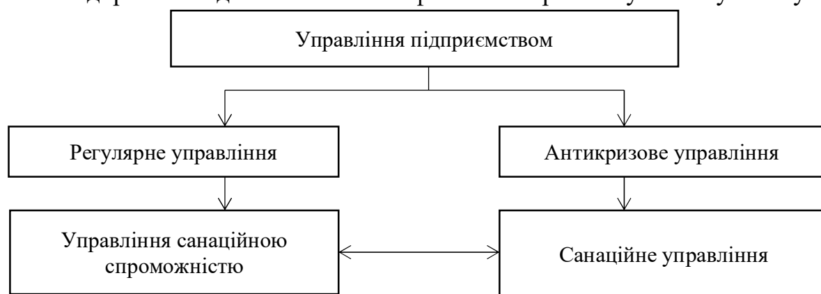
Рис. 1. Місце управління санаційною спроможністю підприємства в загальній системі управління підприємством

Отже, можна зробити висновок, що санаційна спроможність підприємства – це складна економічна категорія, яка відображає оцінку здатності підприємства до виживання та ефективного розвитку в майбутньому.