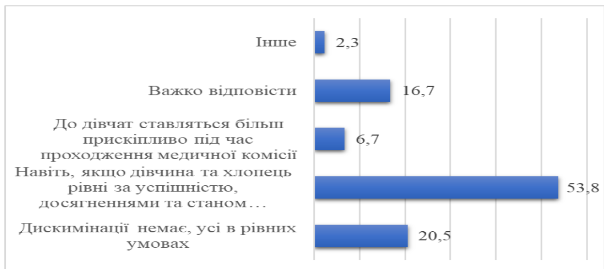
Рис. 2. Розподіл відповідей на запитання «Як Ви вважаєте, чи існує зараз дискримінація жінок (дівчат) під час вступу до вищих закладів вищої освіти, які готують працівників поліції?», %.

Також респонденти переконані, що під час вступу до ЗВО зі специфічними умовами навчання присутня деяка дискримінація жінок (дівчат): навіть якщо дівчина і хлопець рівні за успішністю, досягненнями та станом здоров'я, все одно перевагу віддадуть хлопцеві – так вважають 53,8 % опитаних, на думку 6,7 % здобувачів до дівчат ставляться більш прискіпливо під час проходження медичної комісії. Також 20,5 % опитані переконані, що дискримінації немає, усі в рівних умовах (див. Рис. 2).