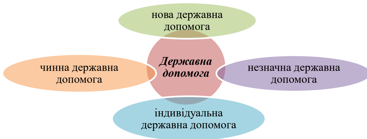
Рис 2. Види державної допомоги

Нова державна допомога – це будь-яка державна підтримка суб'єктів господарювання, що не являється чинною державною допомогою, а також внесення істотних змін до умов надання чи обсягу чинної державної допомоги.